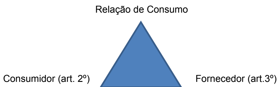
Figura 2 – Formação da Relação de Consumo~

Uma relação de consumo é composta de um lado pelo consumidor, vinculado ao conceito legislado pelo art. 2º do CDC e do outro, o fornecedor, caracterizado pela livre iniciativa, sendo pessoas físicas ou jurídicas, conforme se verifica na figura 17.